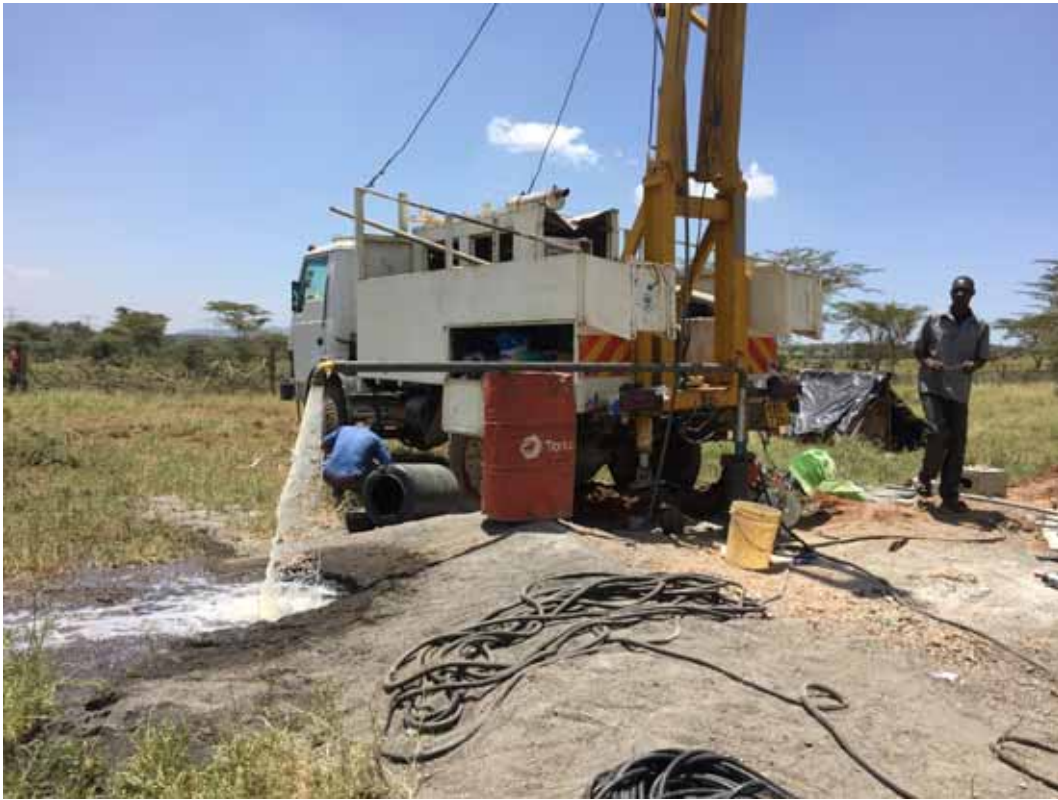
Tämä on kuva koepumppauksesta. Se tuottaa noin 30.000 litraa tunnissa!