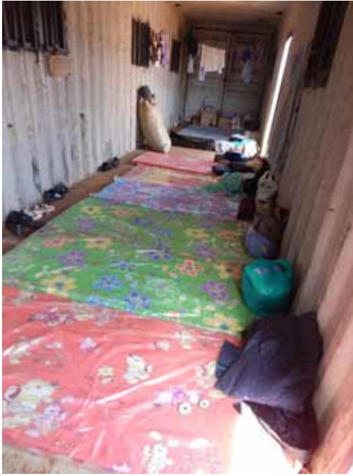
Tämä ei saata näyttää mukavimmalta paikalta nukkumiseen, mutta se on itse asiassa parempi kuin teltta, koska tontilla on yöllä hyvin tuulista ilman vyöryessä Ngong Hillsin kukkuloilta laaksoon.