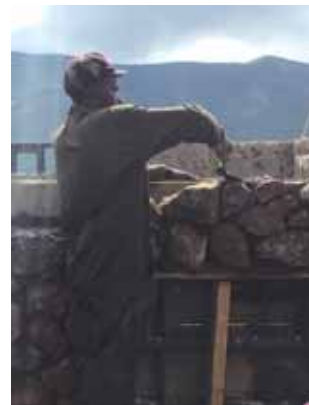
Muurarit tekevät loistavaa työtä.