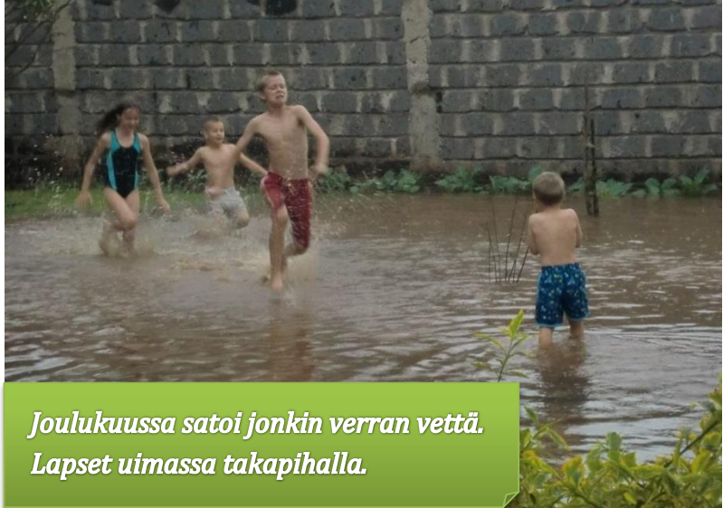
Joulukuussa satoi jonkin verran vettä. Lapset uimassa takapihalla.